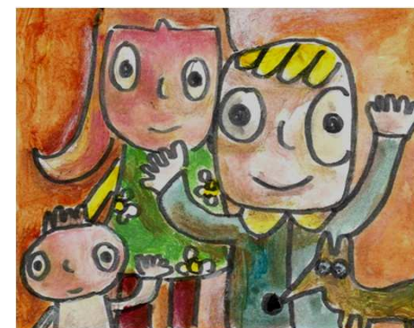
Carte réalisée lors de l'atelier dessin

⇒ Où se construisent des liens avec les autres GEM et Associations de la cité